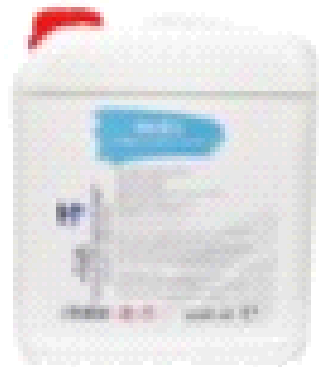
DEZINFECTANTI 5 L